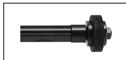
FG-50L-1A & FG-50Y-1A (内面研削専用機)